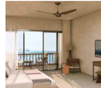
Wohnbeispiel Doppelzimmer mit Meerblick (Modellbild)