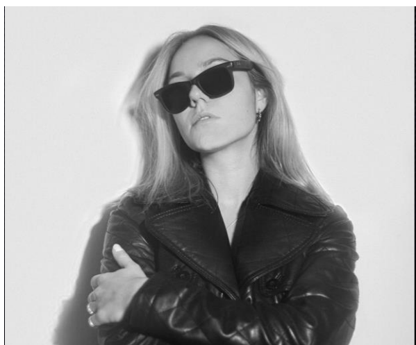
DJane und Musikproduzentin

Aldiana Club Salzkammergut vom 19.01. bis 25.01.2025